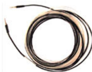
Sensor em Fibra Óptica